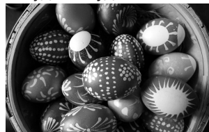
Рисунок также можно нанести иголкой по уже окрашенным яйцам. Для этого рисунок иголкой просто выцарапывают.

Можно нанести рисунок на яйцо воском и затем окрасить. После окрашивания яйца остудить и удалить воск.